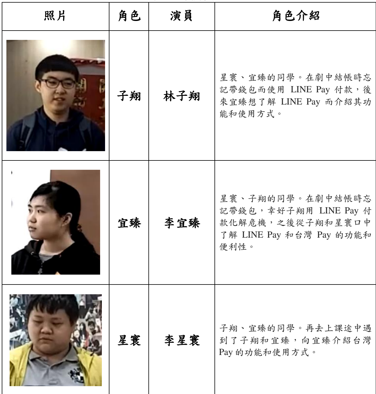
表 3 微電影角色介紹